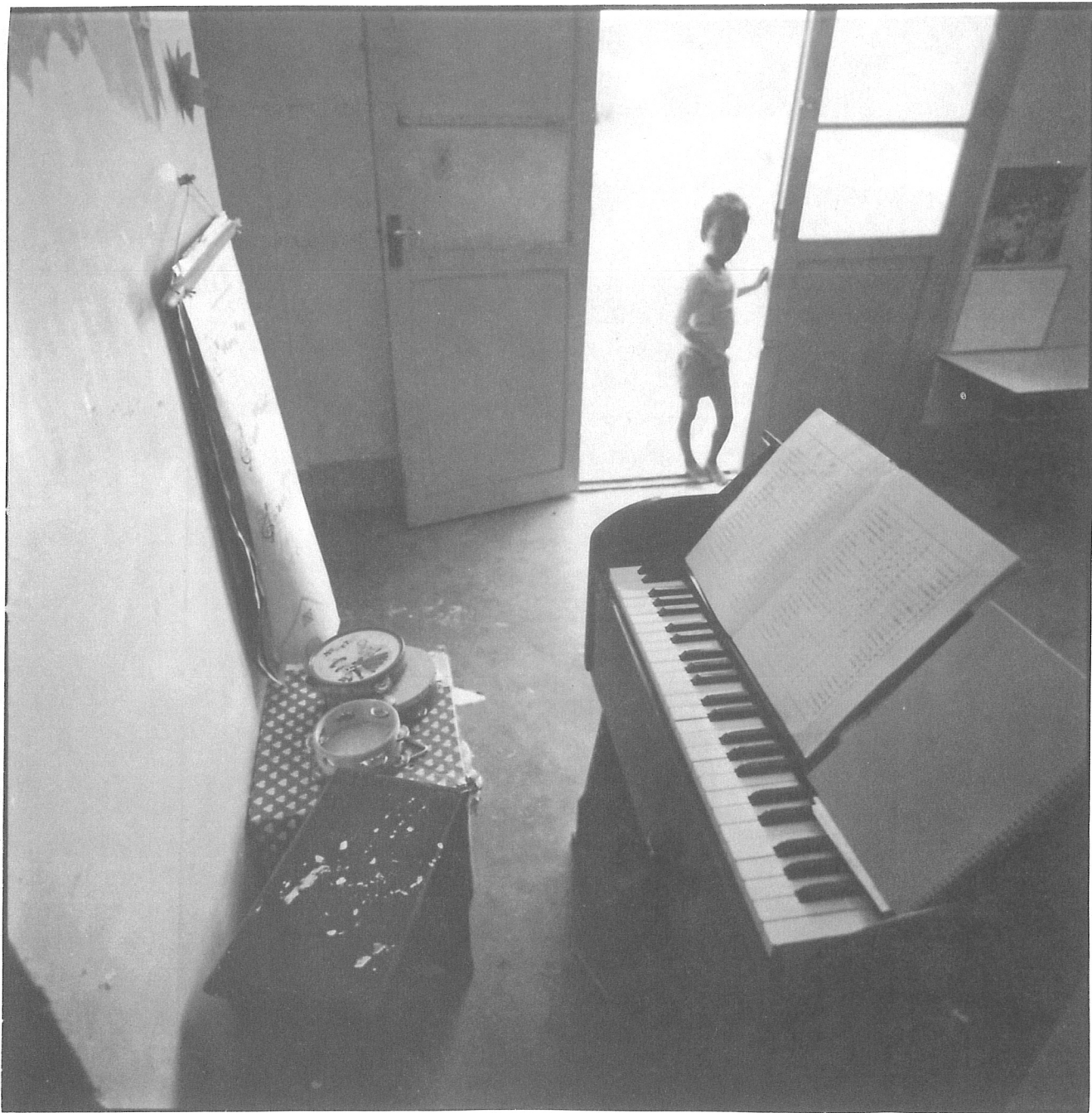
台東，蘭嶼島，蘭恩幼稚園，1979年