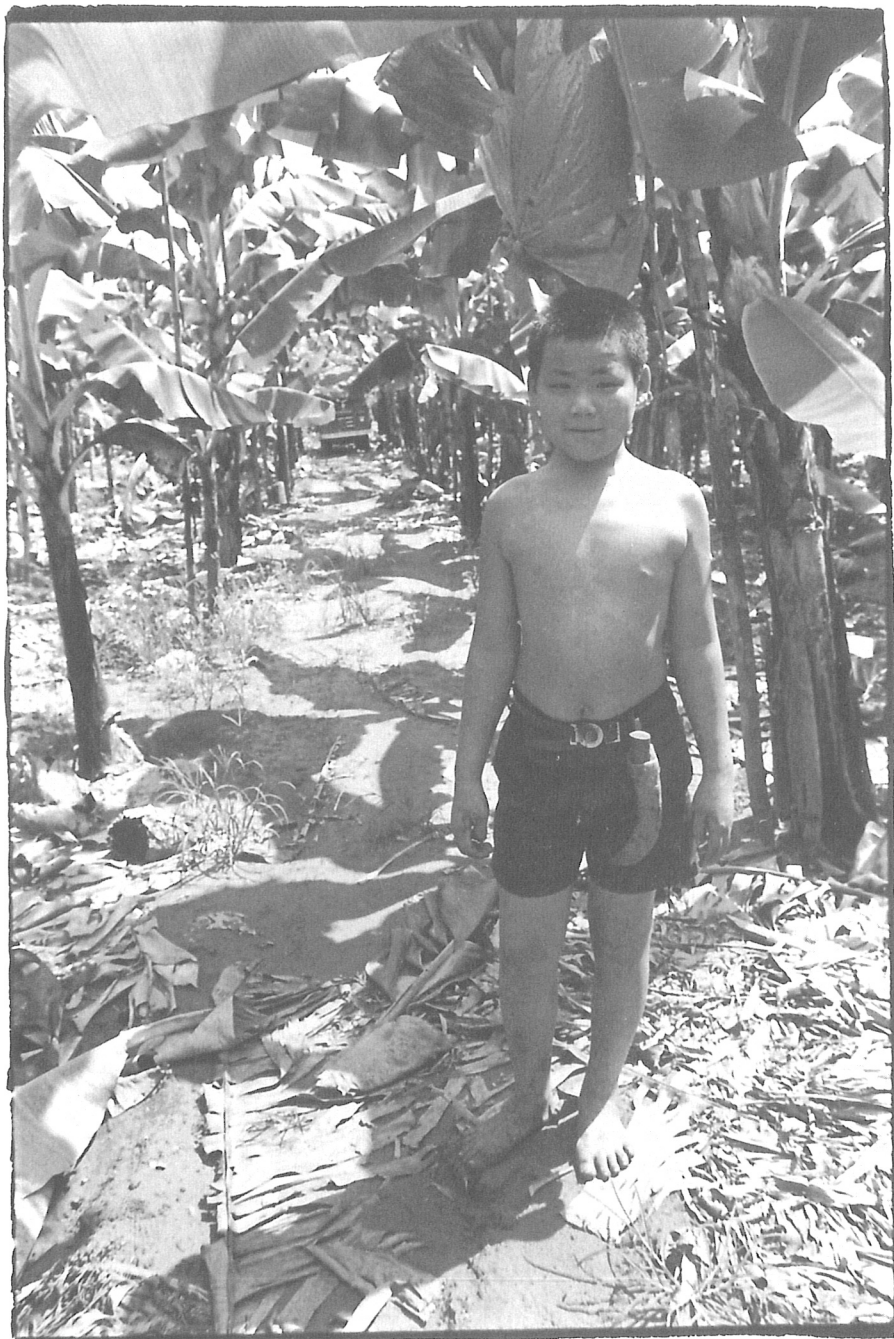
高雄，旗山溪小蕉農的暑假作業，1979年