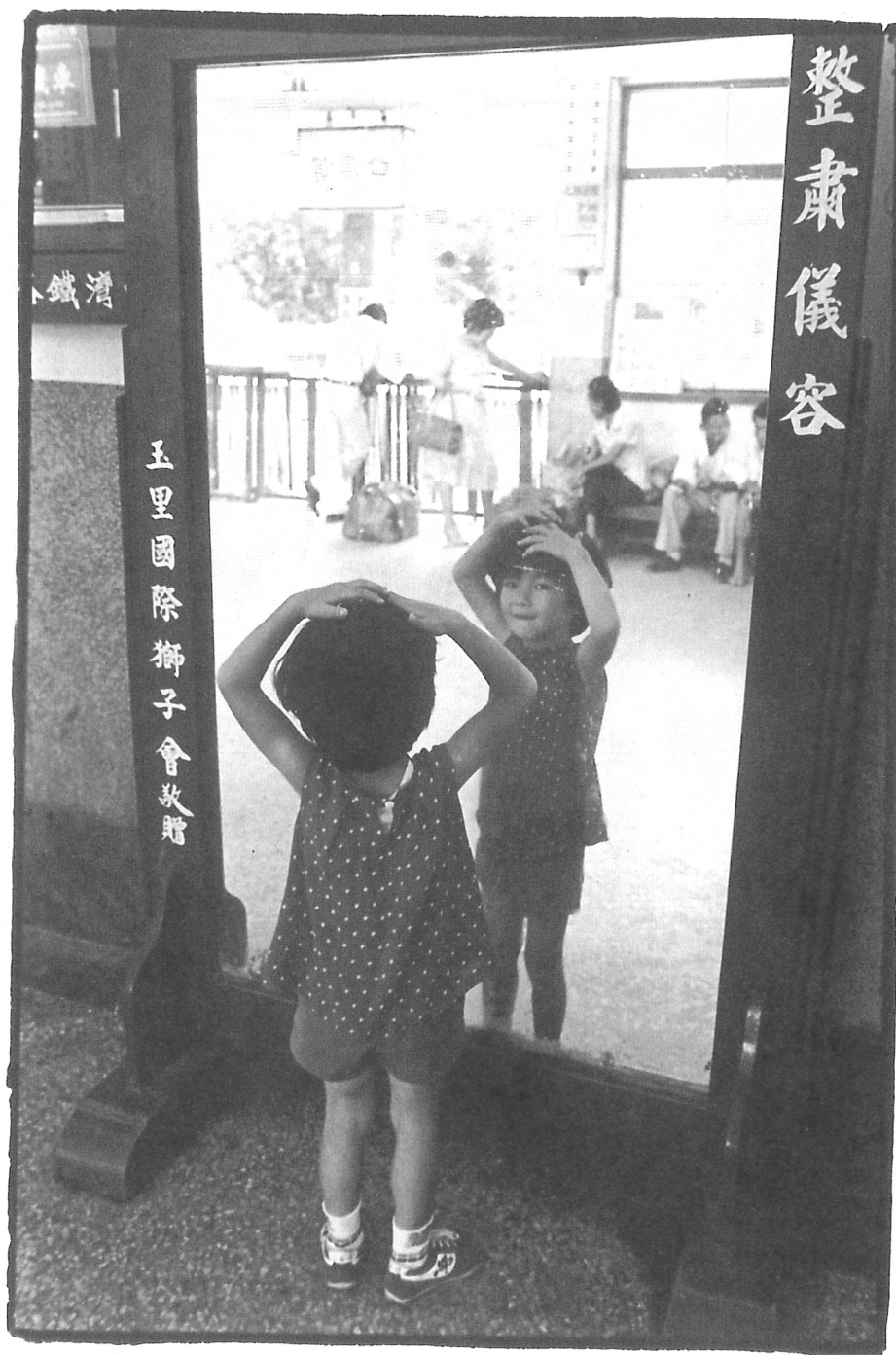
台東，玉里火車站，1980年