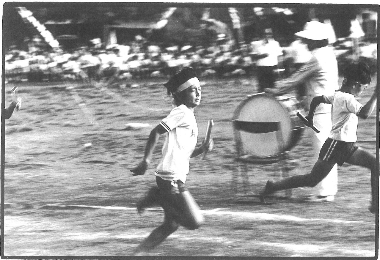
員林，國小運動會，1976年