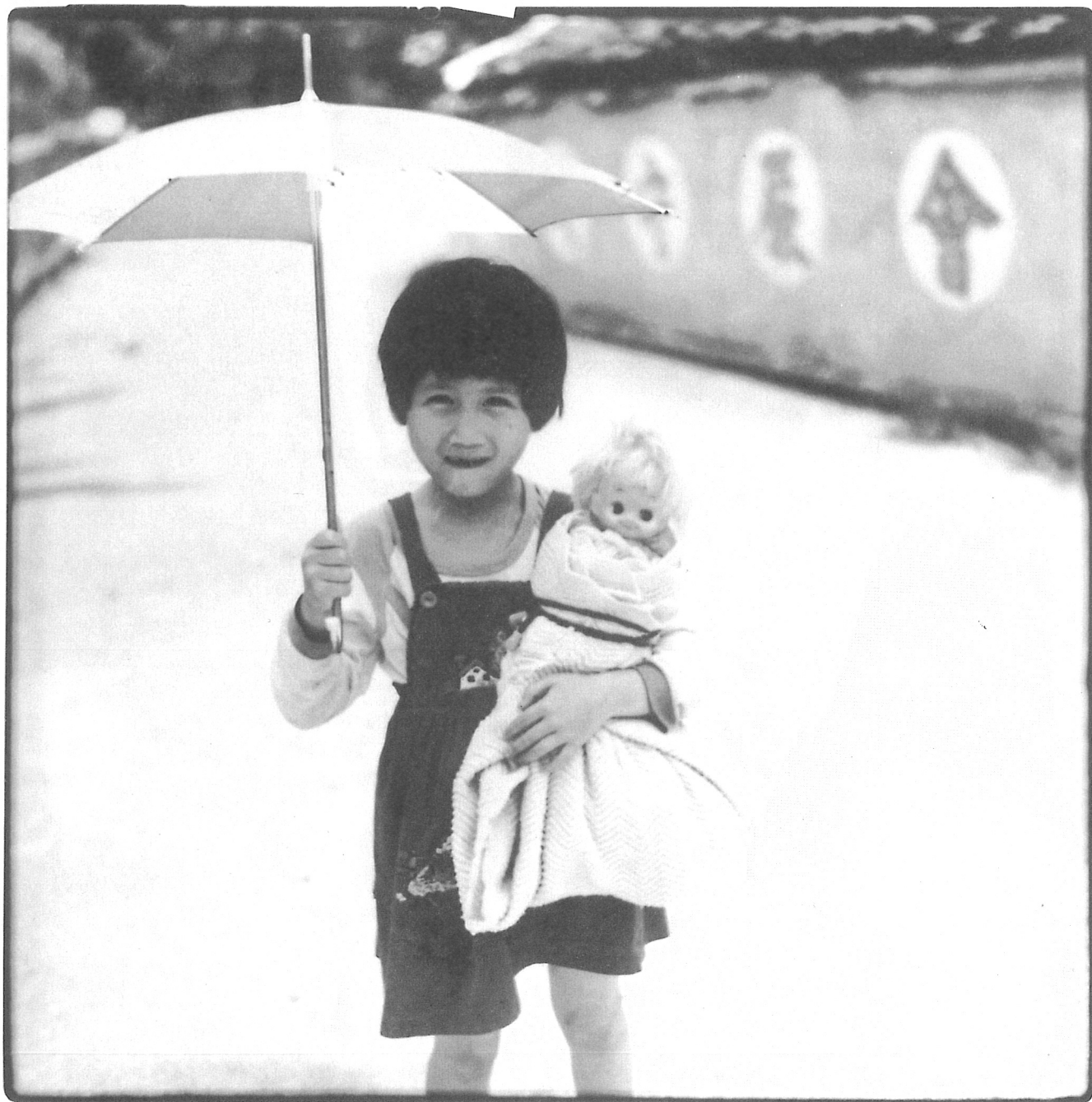
埔里，烏牛欄農莊，1978年