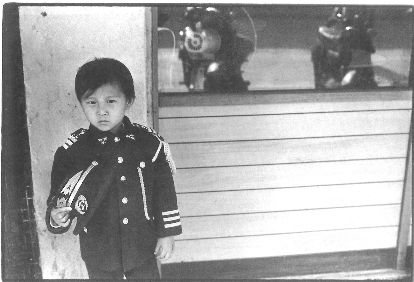
台北，衡陽路(春節前後)，1975年