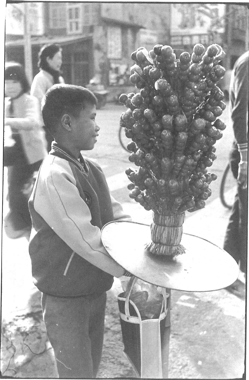
彰化·鹿港市場(春節前，賣糖葫蘆)，1978年