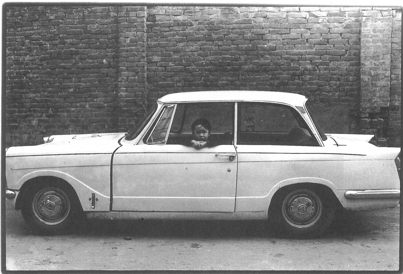
台北，雙連鐵路傍，1973年