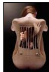
彩绘精典：囚禁者的思考