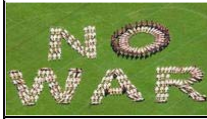
悉尼妇女裸体排出反战标语