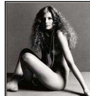
某毛衫广告大胆出位

有人试过，在网上搜索一下“写真”这两个字，你将会找到大量的裸照。裸风吹得时人醉，一脱而为天下先，裸露俨然已经成为一种时尚了，成为一种“看我的”竞赛了。