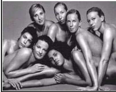
德国女排裸体艺术照

按照罗伯茨自己的说法，这些裸奔行为，一半是胡闹，另一半是为了慈善事业。以1994年利物浦同埃弗顿的德比战上的那次裸奔为例，他就因此为当地一家儿童医院争取到了200英镑募捐。