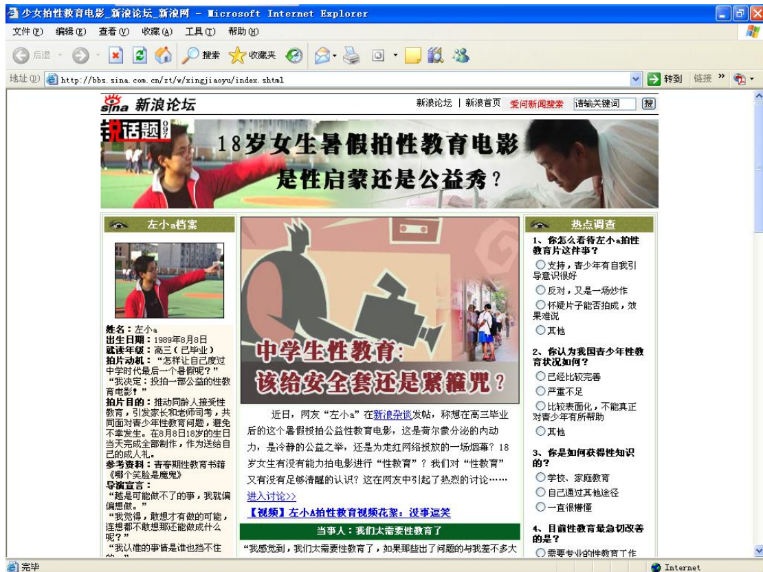
图 8 博客：“18 岁女中学生利用暑假拍性教育电影”的活动 截图（2008-10-11）