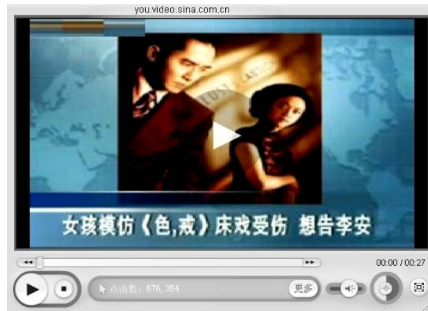
图 5 网站视频：女孩模仿色戒床戏受伤，要告李安

这篇手记很快就被媒体以《女孩模仿<色戒>床戏受伤，要告李安》为题做了报道 3 。除了香港、新加坡等海外媒体，国内几乎所有都市类和生活类报纸都报道了这个消息，还有一些电视台、电台以及包括新华网、中新网、CCTV和各大门户网站都播报了这个消息（图 5）。