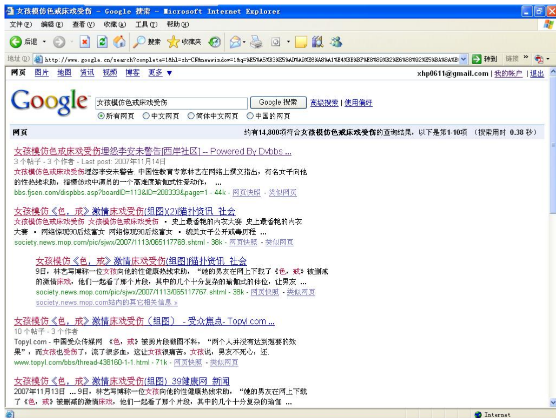
图 6 Google 搜索引擎输入“女孩模仿色戒受伤”的搜索结果 截图(2008-10-11)

在 google 搜索引擎输入“女孩模仿色戒受伤”，约有 14,800 项符合查询结果的相关网页（2008-10-11 18:28，图 6）。其阅读人数难以估计。