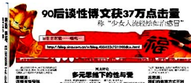
图 11 《今日女报》报道截图