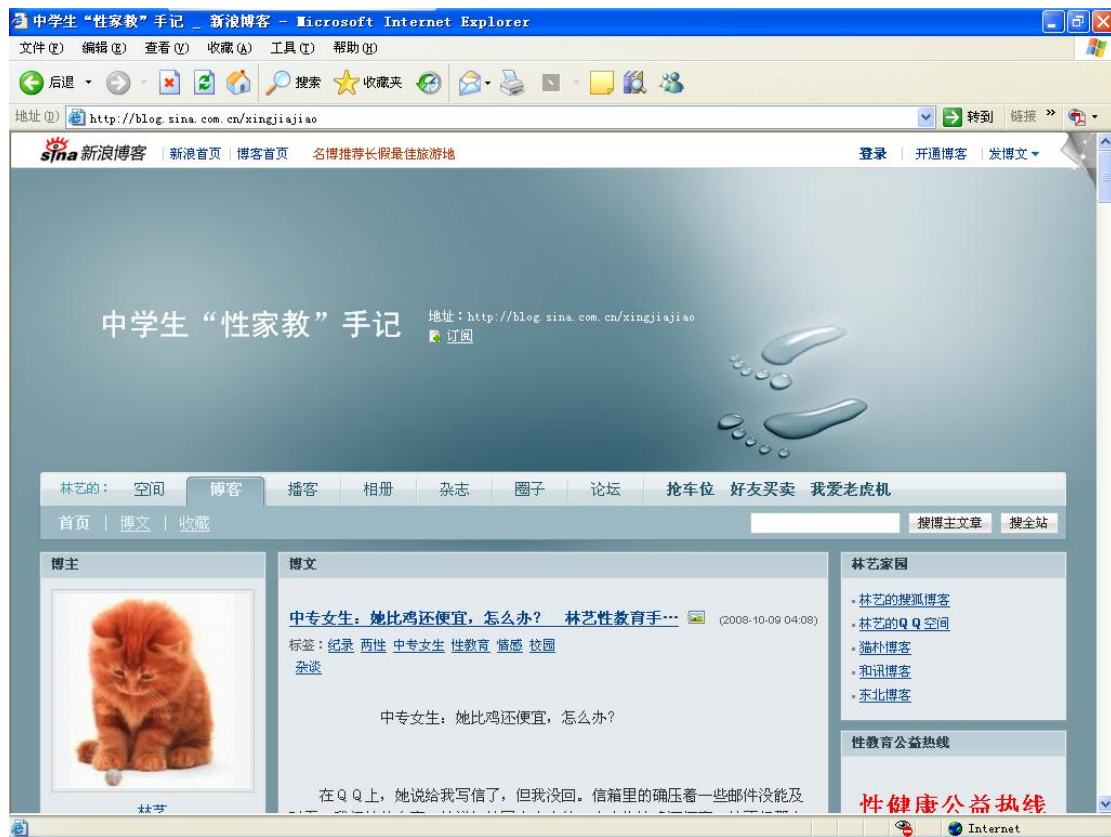
图 2 博客：中学生“性家教”手记 截图(2008-10-11)