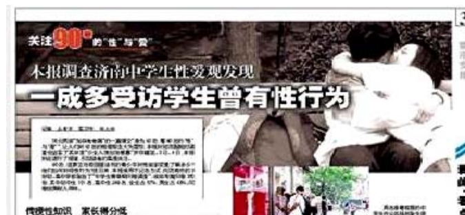
图 12 《今日女报》报道截图

通过讨论，对“90 后”有了更深入的剖析。记者还到多家医院进行调查，结果证实所说的“少女人流如治感冒”并不是瞎说（图 12）。