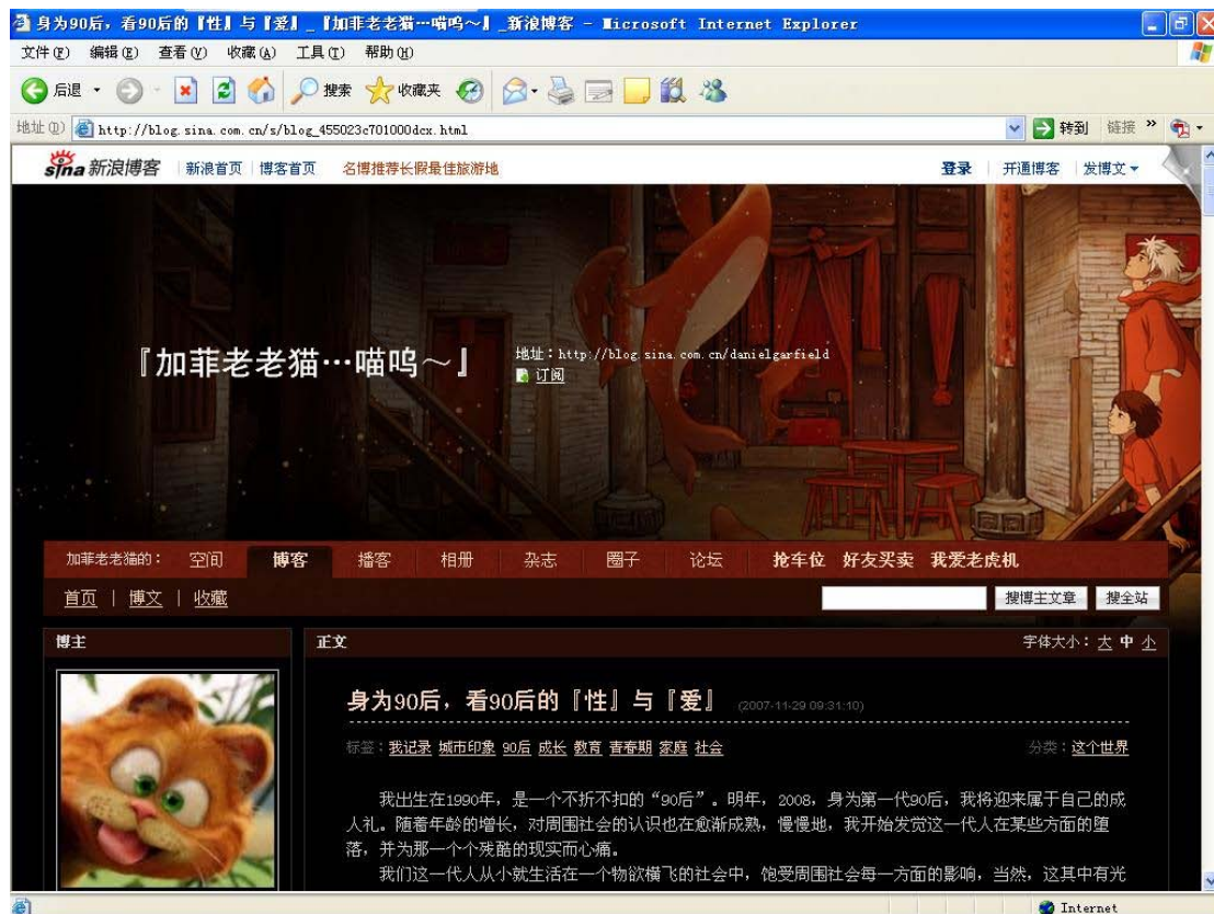
图 10 博客文章：身为 90 后，看 90 后的“性”与“爱” 截图（2008-10-11）

就在 2007 年 12 月初，一篇《身为 90 后，看 90 后的“性”与“爱”》的博客文章 5 引起了轩然大波（图 10）。仅 3 天的时间，这篇文章的点击量已经超过了 42 万（图 11），并被转载到各大论坛，网友评论如潮，也引起了媒体的关注和讨论。