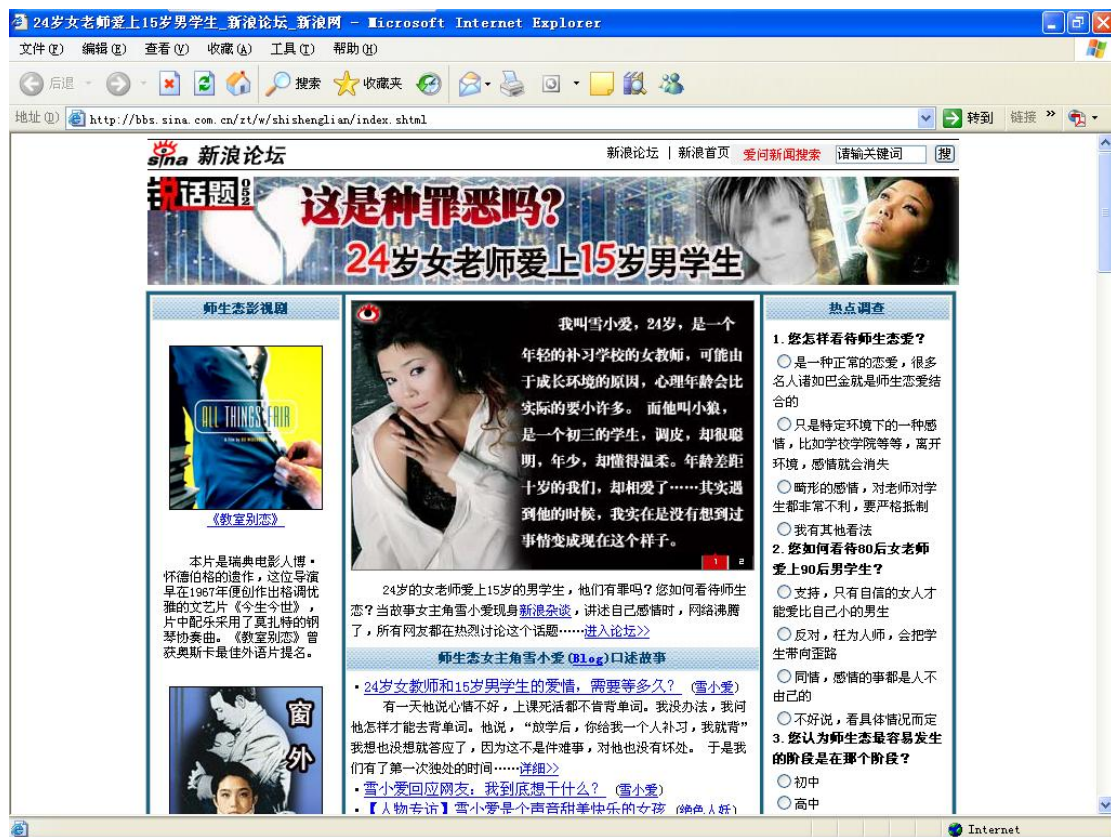
图 7 博客：24 岁女老师与 15 岁小男生的爱情 截图（2008-10-11）