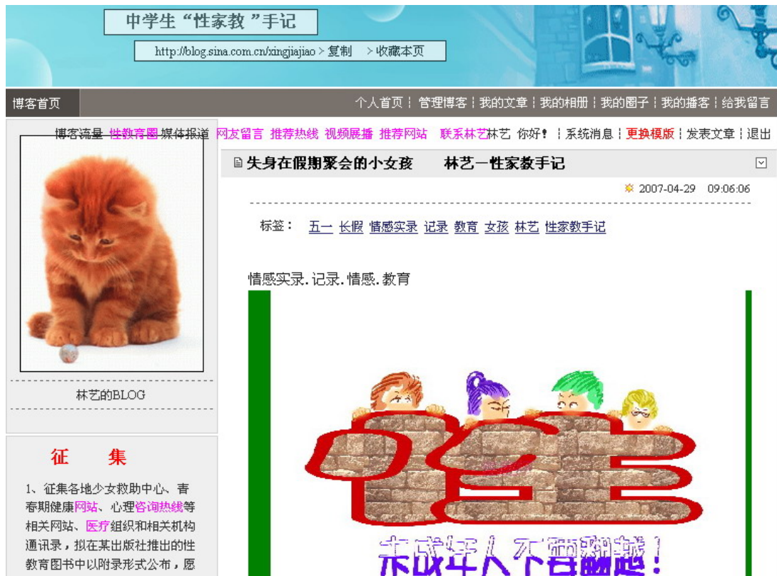
图 1 中学生性家教手记系列博客之一 截图(2008-10-11)

这种互联网性教育，因其取得了较好的效果，无论对弥补中国大陆性教育不足，还是对减少青少年涉性问题和社会的和谐稳定，都具有重要意义。