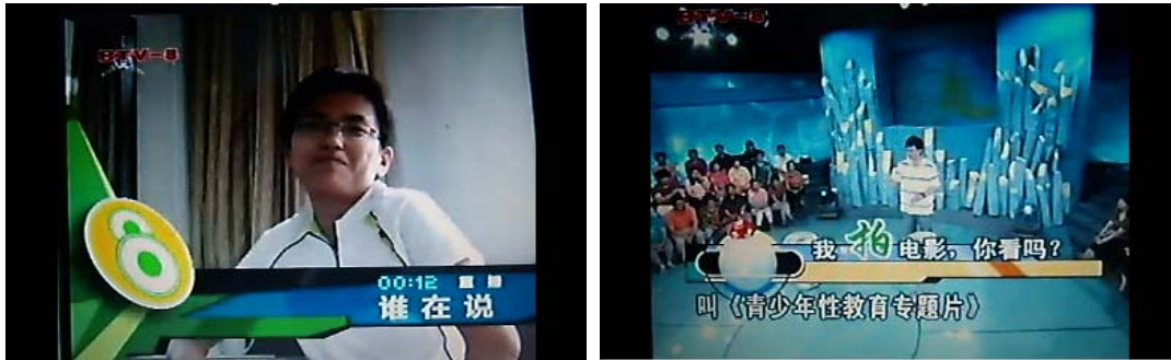
图 9 北京电视台、凤凰新媒体分别对左小 A 的专题节目视频截图