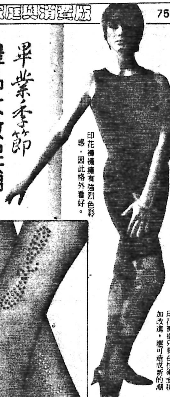
印花織物擁有強烈色彩感，因此格外看好。

【本報巴黎訊】法式織花、印花，而獨佔了市場消費額的半數。去年主要的流行項目如織花、水鑽等，因平均售價由一九八四年的六法郎提高至八、五法郎，而獨佔了市場消費額的半數。此外，由於花織的年平均壽命為一、二個季度，因此，印花織物的平均壽命為一、二個季度，因此，印花織物的平均壽命為一、二個季度。 今年所推出的印花織物，雖然透過新聞媒介大肆宣傳，但由於受到經濟限制，仍未受到一般女性的認可。至於業者方面，態度亦十分保守。據業者認為，印花織物能否暢銷，而後者是否再度暢銷，而後者的命運仍在未定之天。業者則認為兩年來，印花織物一直是花式的天下，印花織物只要在技術上稍加改進，應可造成新的局面。