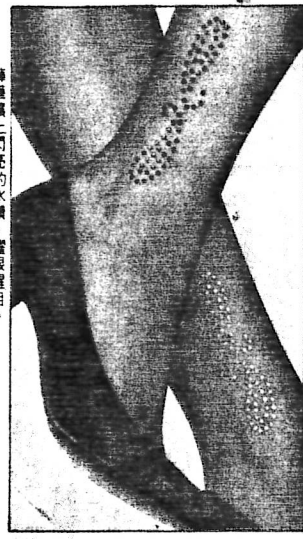
印花織物擁有強烈色彩感，因此格外看好。

織花織物目前正處於一個「後顧之憂」，可以專心事業發展，而在感恩之餘，不尋求外遇，以免危及女人的「終身依靠」。 就連女人的感性世界也是由親情、愛情、童年、子女為重心，完全沒有考慮到自身的潛能和發展，或自己做為一個完整的人所應有的成長權利。在婦女版常見的一些文章雖描述女性內心的某些掙扎與覺醒，但結論却多半是要