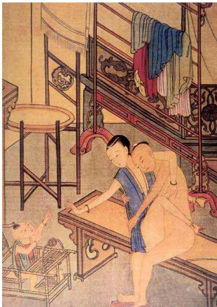
春宫画：春凳上的嬉戏

宫卷的卷首中指明他画了一套“十荣”，即十种不同的性交姿势，但这些画并没有流传下来。至于唐寅的春宫画，后世有不少记录。明作家陈继儒所辑著的《太平清话》中指出唐寅写有与*女嬉戏的记录，书名《风流遁》。《太平清话》云：唐伯虎有《风流遁》，数千言，皆青楼中游戏语也。此书已经失传，但从中可以看到，唐寅作春宫画是有他的生活基础的。另外，在《风流全集》一书的序言中，指出该书的春宫图是根据唐寅的《竞春图》绘成的。在《鸳鸯秘谱》中也提到唐寅有另一套差不多的作品，叫“六奇”，这也许就是唐寅的所谓“花阵六奇”。此画已不可见，但描述这些画的文字却保存了下来。