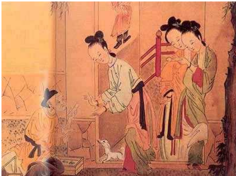
春宫画：古代女子购买性用品

http://blog.sina.com.cn/s/blog_639404eb0100mvkc.html