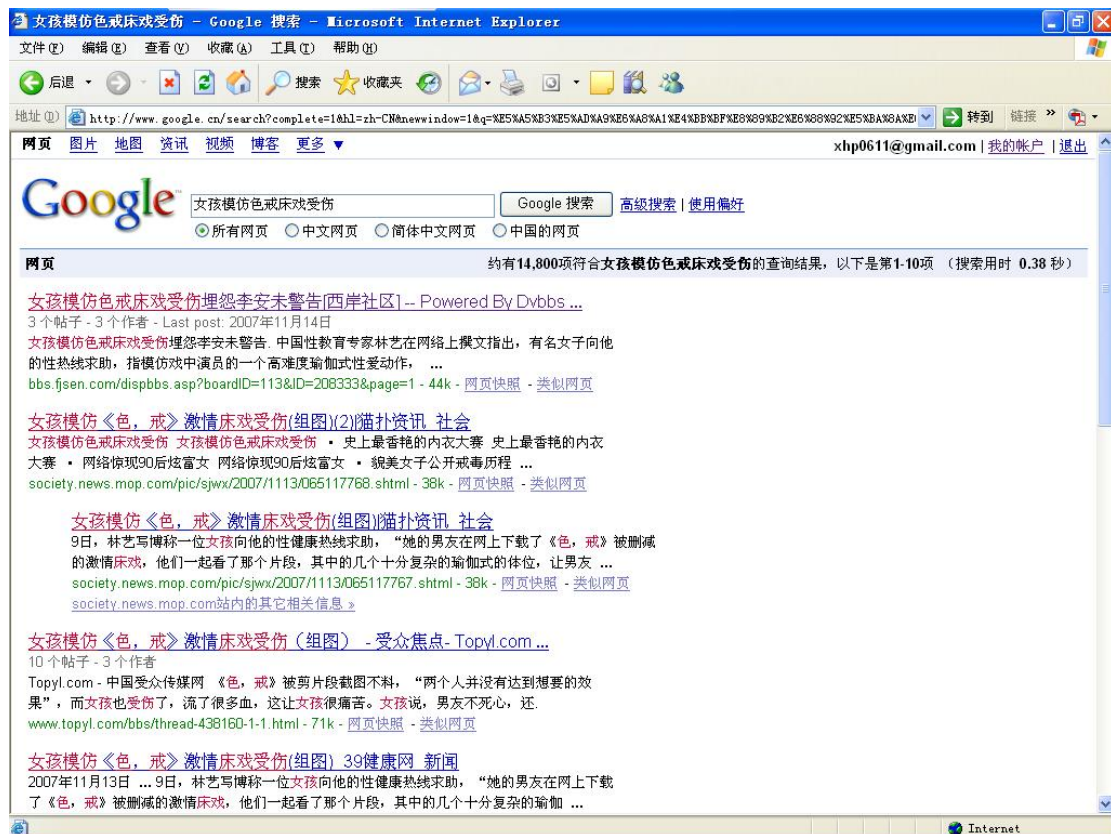
图 6 Google 搜索引擎输入“女孩模仿色戒受伤”的搜索结果 截图(2008-10-11)

这篇文章在博客上的点击量有近 17 万人次，而且广州的《羊城晚报》、《南方日报》，长沙的《今日女报》和天津的《健康周报》等报刊都全文发表了这篇文章。这又会使上百万人看到这篇文章，并接受到相关教育信息。