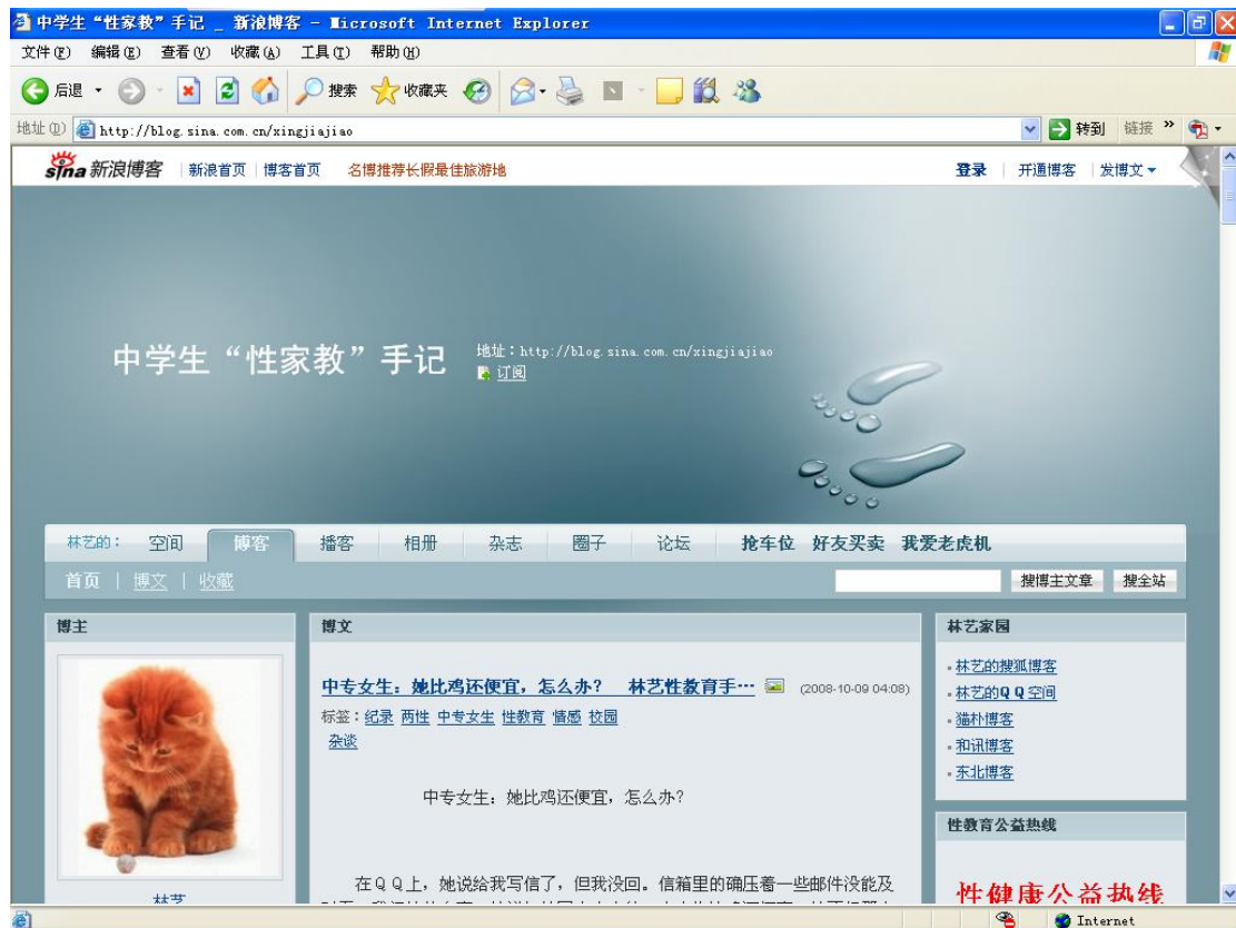
图 2 博客：中学生“性家教”手记 截图(2008-10-11)