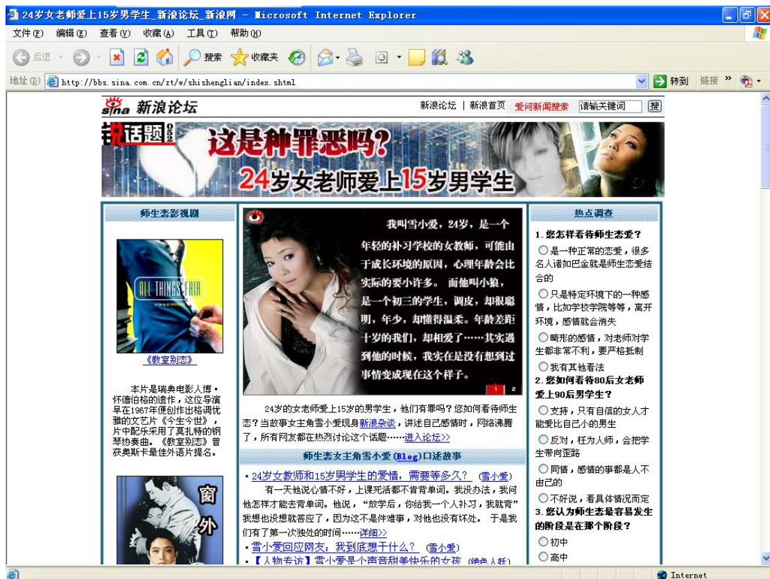
图 7 博客: 24 岁女老师与 15 岁小男生的爱情 截图(2008-10-11)

发这篇文章, 笔者就是想引导网民讨论一下, 面对一个暗恋自己的学生, 老师究竟应该怎么做? 通过网络的力量, 让一些老师清醒, 让一些学生清醒。