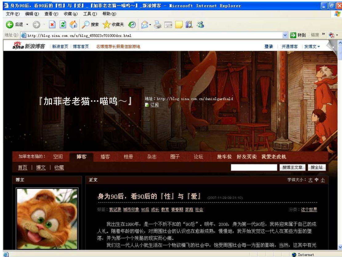
图 10 博客文章：身为 90 后，看 90 后的“性”与“爱” 截图(2008-10-11)

就在 2007 年 12 月初，一篇《身为 90 后，看 90 后的‘性’与‘爱’》的博客文章 5 引起了轩然大波(图 10)。仅 3 天的时间，这篇文章的点击量已经超过了 42 万(图 11)，并被转载到各大论坛，网友评论如潮，也引起了媒体的关注和讨论。