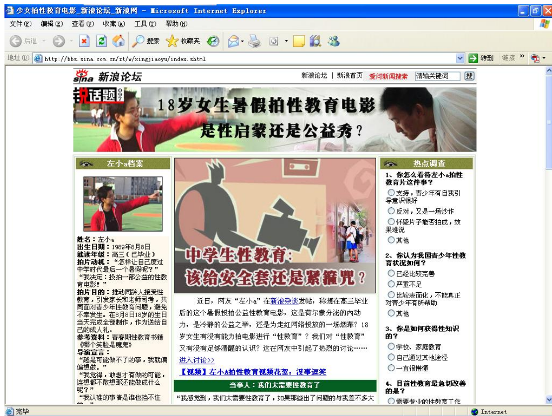
图 8 博客：“18岁女中学生利用暑假拍性教育电影”的活动 截图(2008-10-11)

我策划这个活动，一是想让世人反思，一个 18 岁的中学生都能为性教育做些什么，你为什么不能？二是让一个热衷公益的人引起关注了，红了之后她还会做公益，而且效果会更好。三是会有很多人关注她的博客，她的博客将成为又一个性教育基地。四是我考虑为她设计一个系列性教育短片，人红了，她的作品就会有人关注了，就会让更多的人从中受到影响。