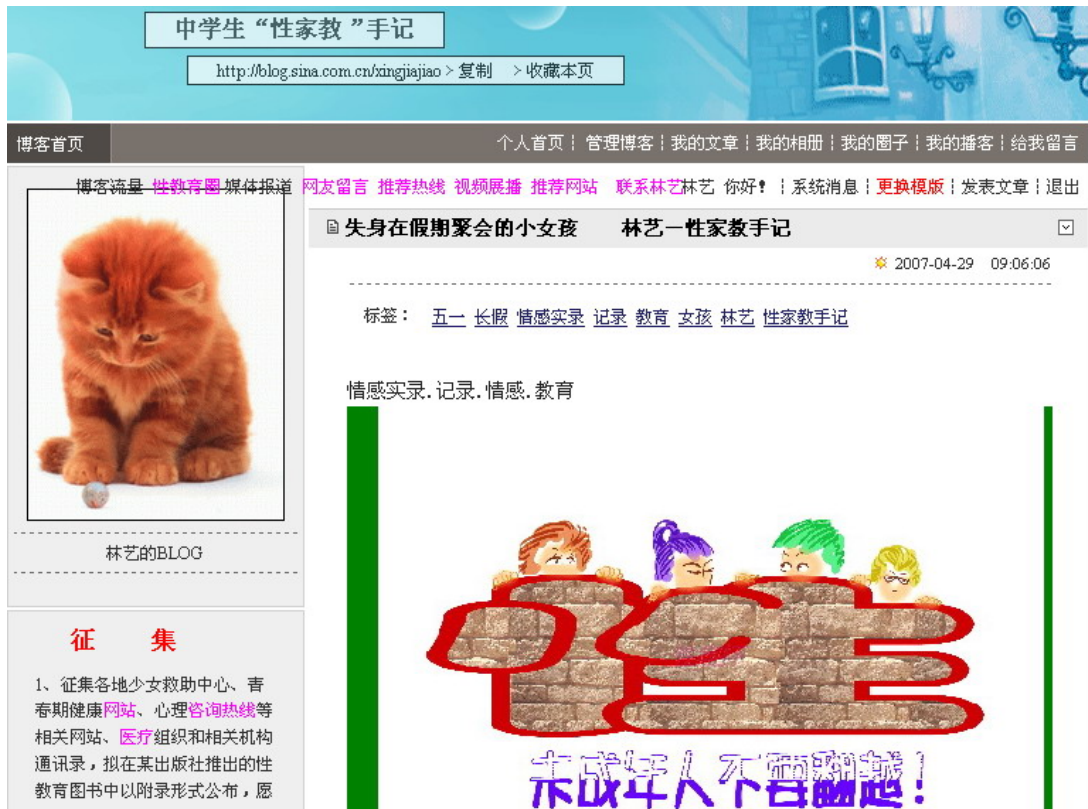
图 1 中学生性家教手记系列博客之一 截图(2008-10-11)

这种互联网性教育，因其取得了较好的效果，无论对弥补中国大陆性教育不足，还是对减少青少年涉性问题和构建社会的和谐，都具有重要意义。