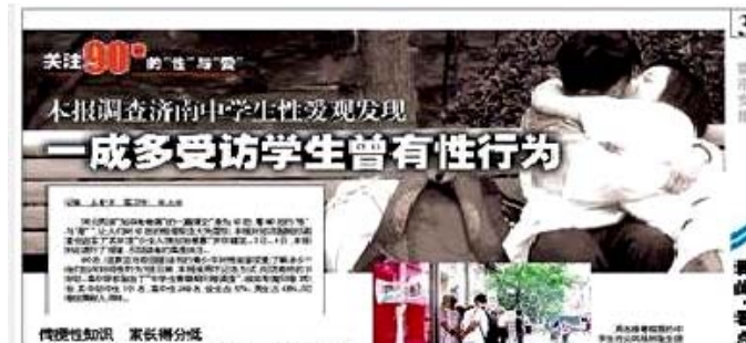
图 12 《今日女报》报道截图

通过讨论，对“90 后”有了更深入的剖析。记者还到多家医院进行调查，结果证实所说的“少女人流如治感冒”并不是瞎说(图 12)。