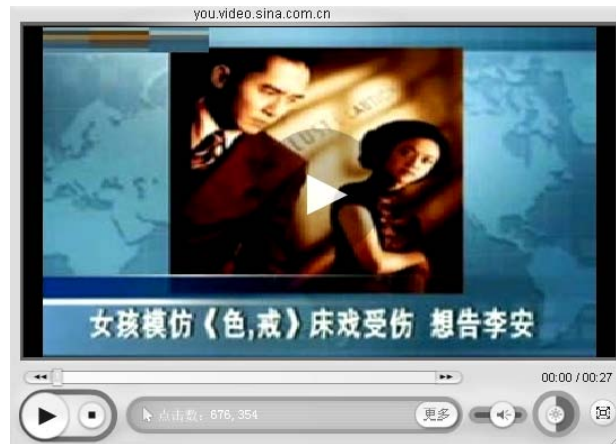
图 5 网站视频：女孩模仿色戒床戏受伤，要告李安

这篇手记很快就被媒体以《女孩模仿<色戒>床戏受伤，要告李安》为题做了报道 3 。除了香港、新加坡等海外媒体，国内几乎所有都市类和生活类报纸都报道了这个消息，还有一些电视台、电台以及包括新华网、中新网、CCTV和各大门户网站都播报了这个消息(图 5)。