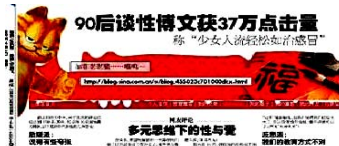
图 11 《今日女报》报道截图

这篇文章的作者是河北的一位中学生，最初他把写好的文章发到了笔者的热线信箱里，想让我评析一下。对于 90 后在性方面的问题，我早有感触，平时接触到的求助有很大一部分是 90 后的，而且他们问的很多问题都已经“成人化”了。